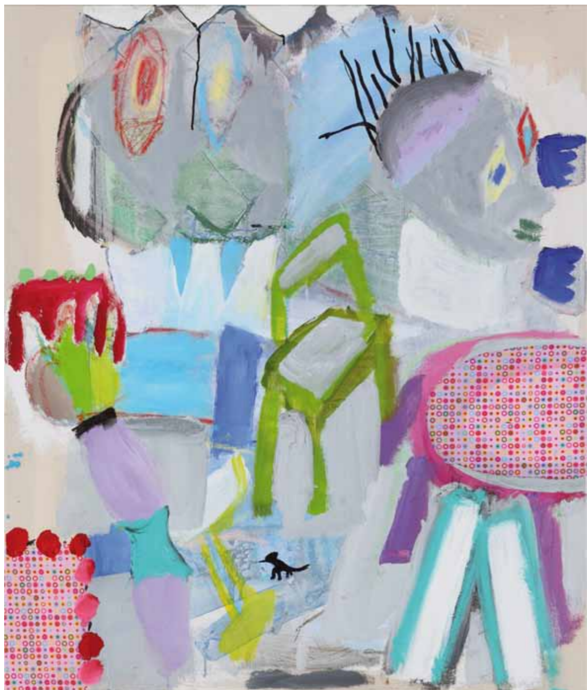
Der gedeckte Tisch / The Table is Set • 2013 • Acryl, Collage auf Leinwand • 100 x 120 cm Script • 2012 • Acryl, Collage auf Leinwand • 100 x 120 cm