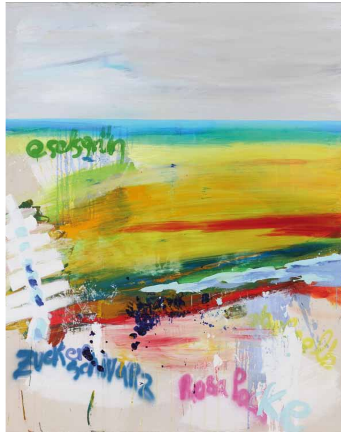
Almiro • 2013 • Acryl auf Leinwand • 160 x 200 cm Sag was / Tell Me • 2013 • Acryl auf Leinwand • 160 x 200 cm