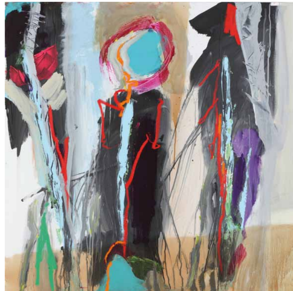
Negev • 2009 • Acryl auf Leinwand • 100 x 100 cm Ramon bush • 2009 • Acryl, Kaffee auf Leinwand • 100 x 100 cm