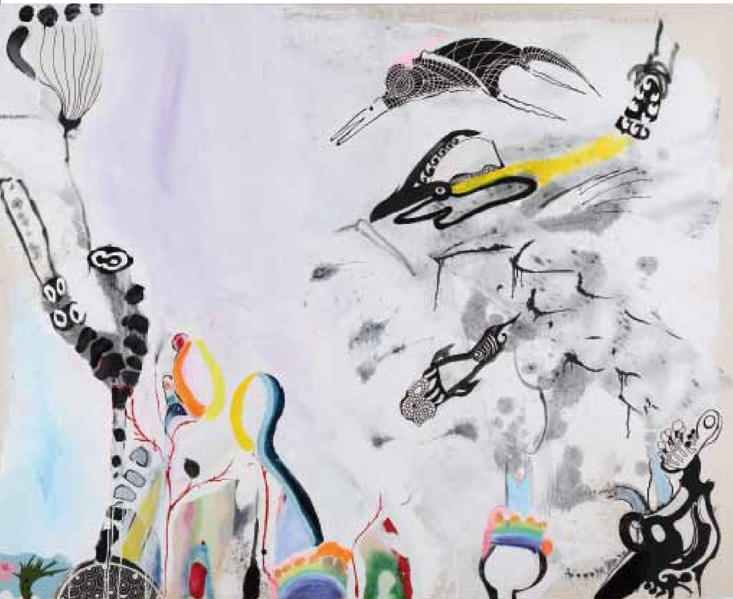
Die Wesen der Nacht beobachten die Entstehung der Farben / Nocturnal Creatures Observe the Creation of Colours • 2012 • Acryl, Collage auf Leinwand • 160 x 200 cm Fado • 2012 • Acryl, Collage auf Leinwand • 160 x 200 cm