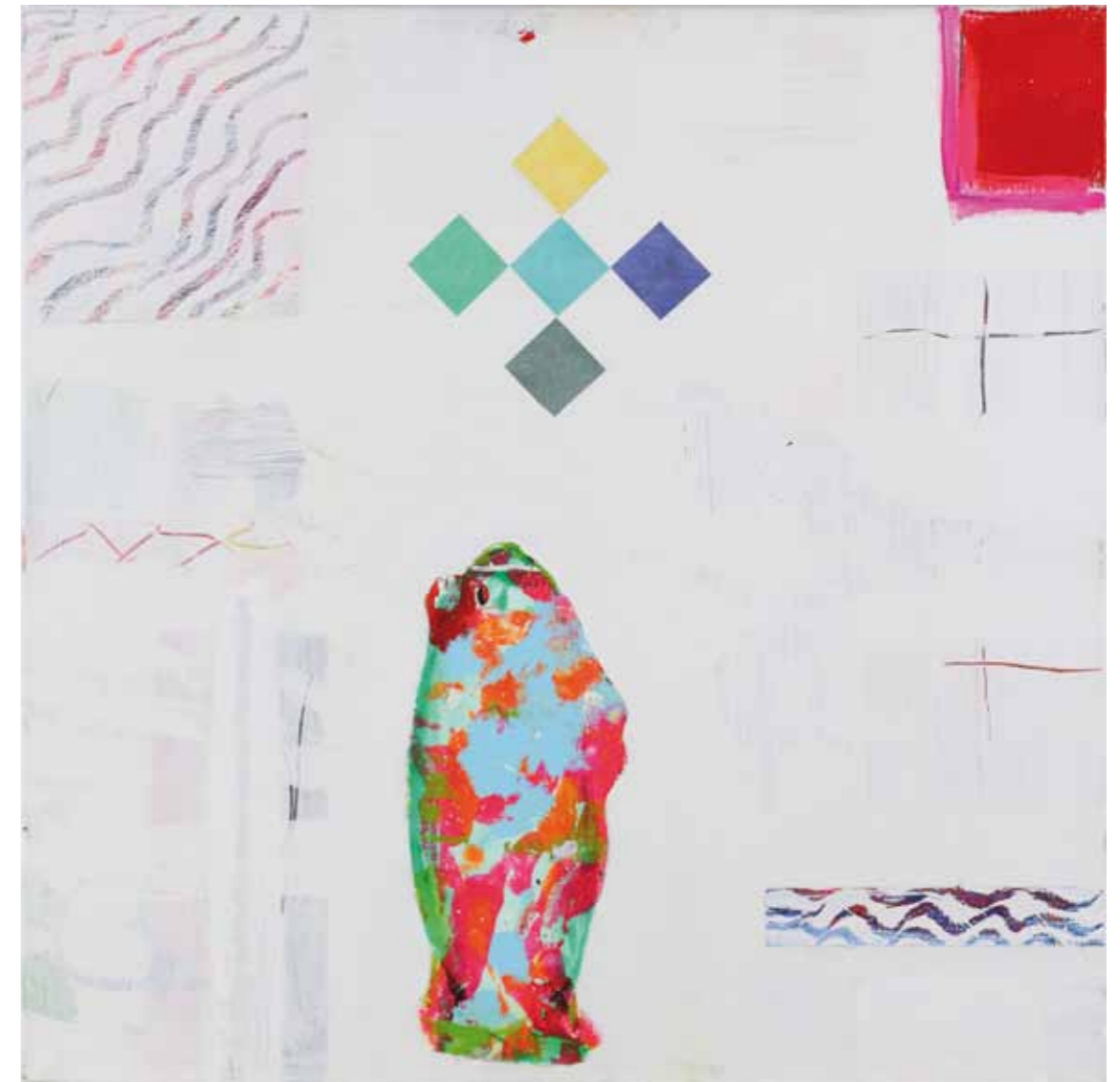
Fish • 2012 • Acryl, Collage auf Leinwand • 80 x 80 cm

William Carlos Williams, Gedichte, Suhrkamp Verlag, 1962 Übersetzung von H.M. Enzensberger