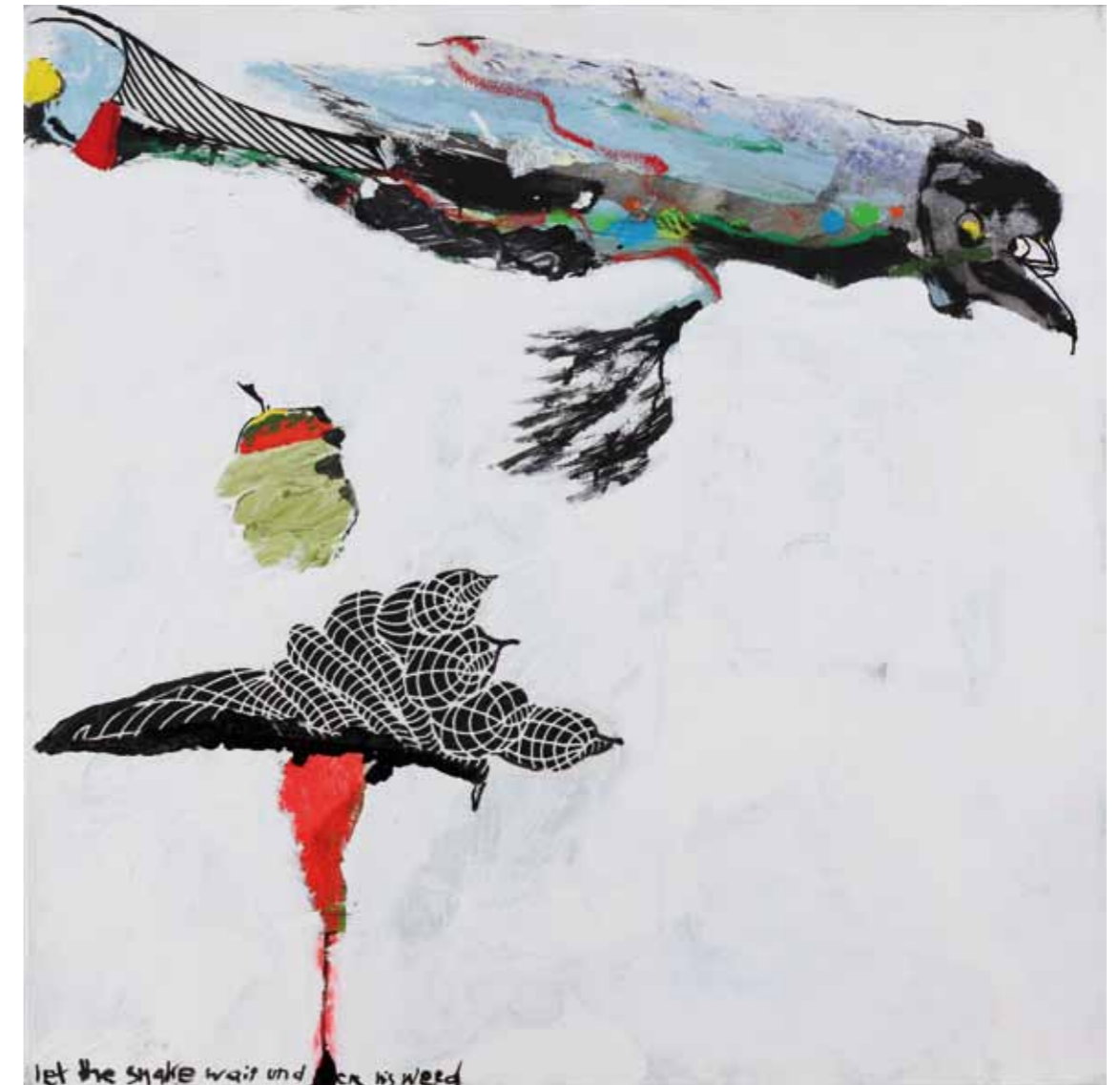
winter winter winter • 2012 • Acryl, Collage auf Leinwand • 80 x 80 cm Letter Dots • 2012 • Acryl auf Leinwand • 100 x 120 cm