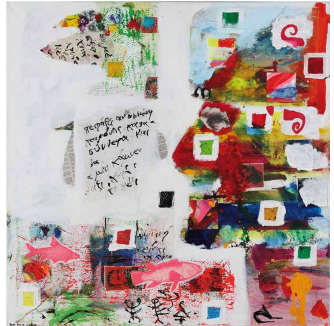
one man show • 2012 • Acryl Collage auf Leinwand • 100 x 120 cm My Ithaki • 2012 • Acryl auf Leinwand • 100 x 100 cm