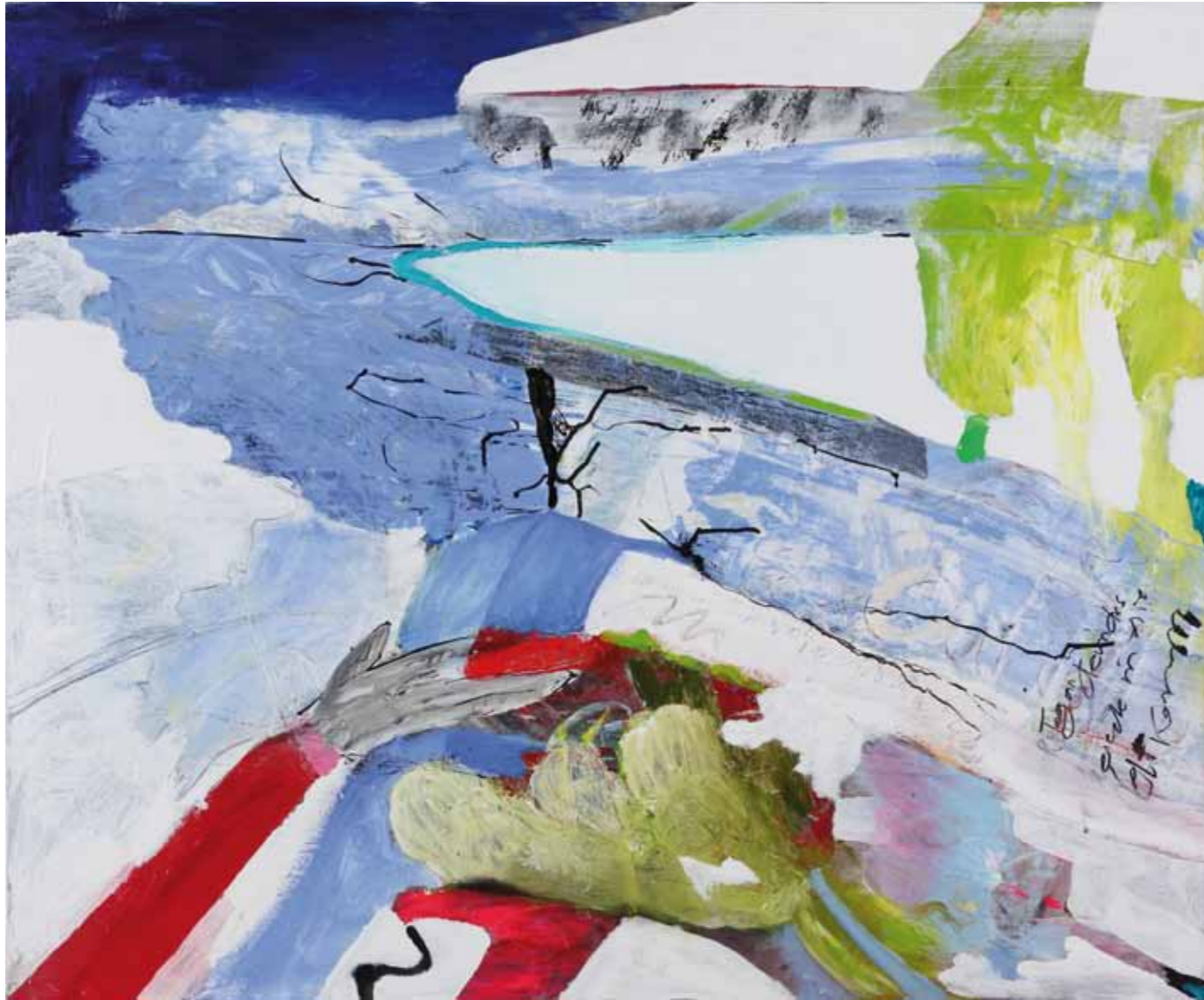
Day 3 • 2012 • Acryl auf Leinwand • 100 x 120 cm Alfama • 2012 • Acryl, Collage auf Leinwand • 160 x 200 cm