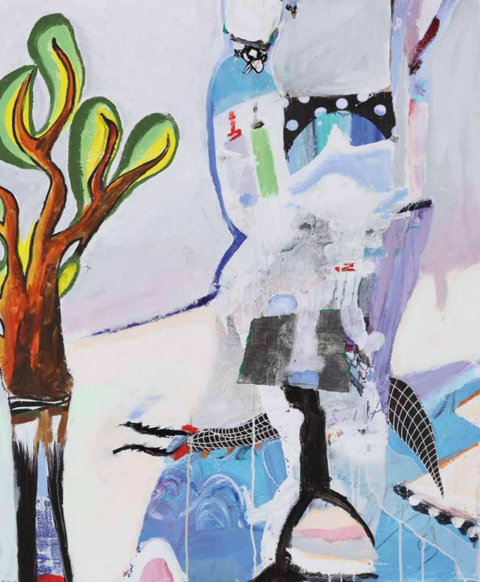
White Calf, out on the Weekend • 2012 • Acryl, Collage auf Leinwand • 100 x 120 cm